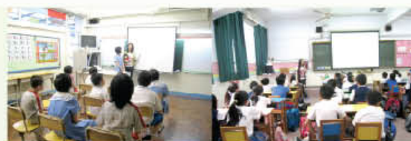
★ 北區中葡小學講座