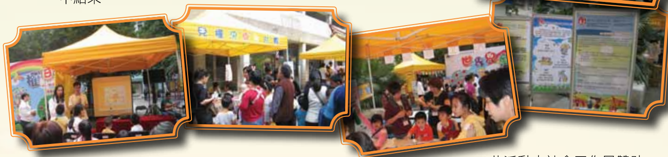
此活動由社會工作局贊助